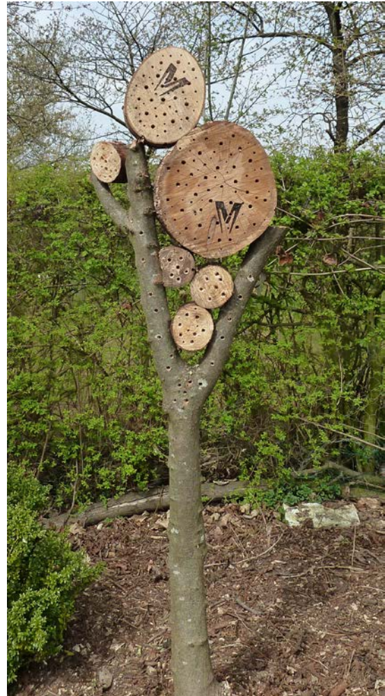
Resortje in een Molenhoekse tuin