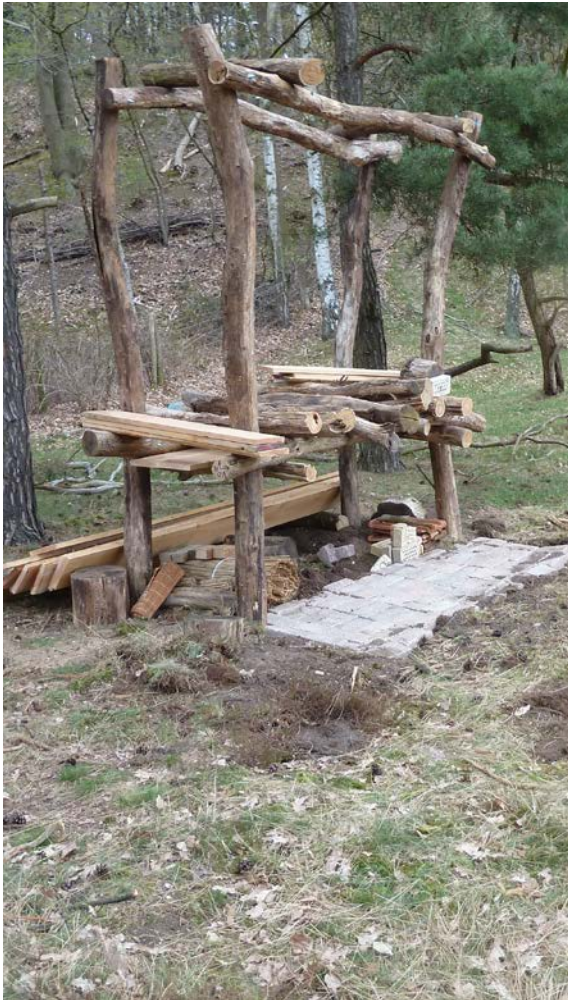
Bijenresort in aanbouw

Maar misschien wel zeker zo rustig voor die nijvere diertjes.